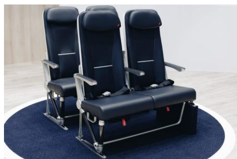
Sièges en fibre de carbone et en titane proposés par Expliseat