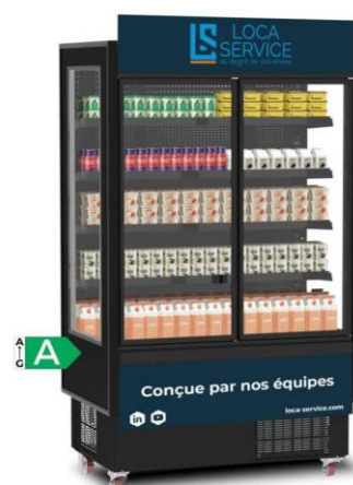
KLASSA, Le premier vertical de classe énergétique A pensé pour la location