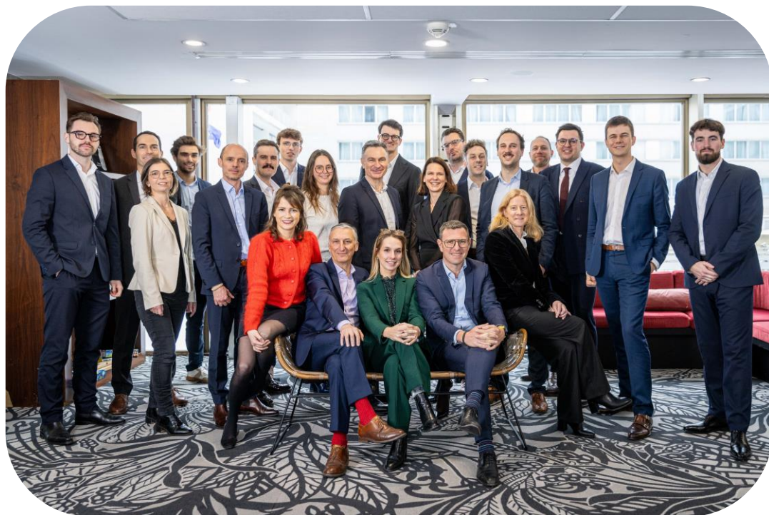
Journée d'équipe le 7 janvier 2026