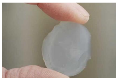
Aérogel proposé par Keey Aerogel